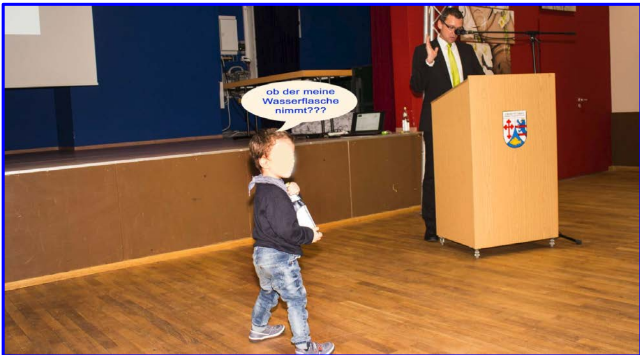
Mitten im Vortrag prescht der kleine Junge nach vorn zum Redner.

Kindergesichter dürfen nur mit Erlaubnis der Eltern veröffentlicht werden.