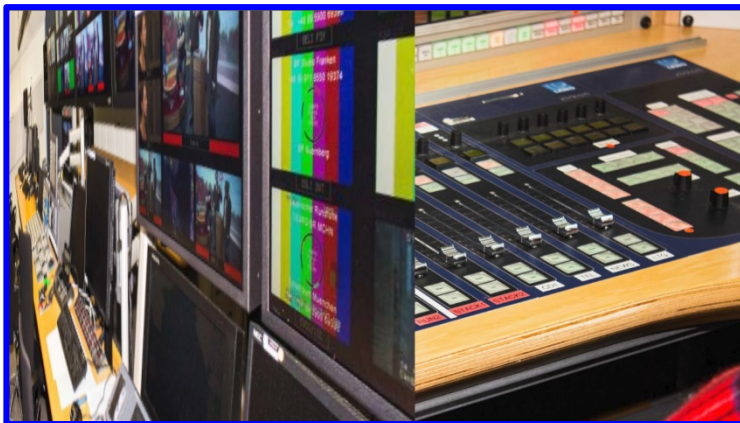
Wie in einem Buch klappt die Seite des Fernsehstudios nach links weg und gibt die Sicht frei für eines der Mischpulte