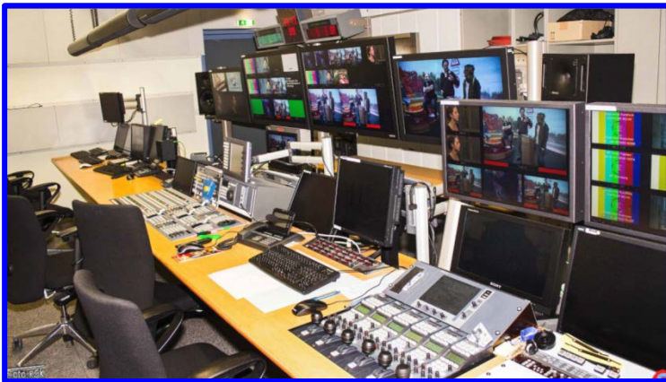
Der Blick in ein Fernsehstudio von Bayern 1 in Nürnberg