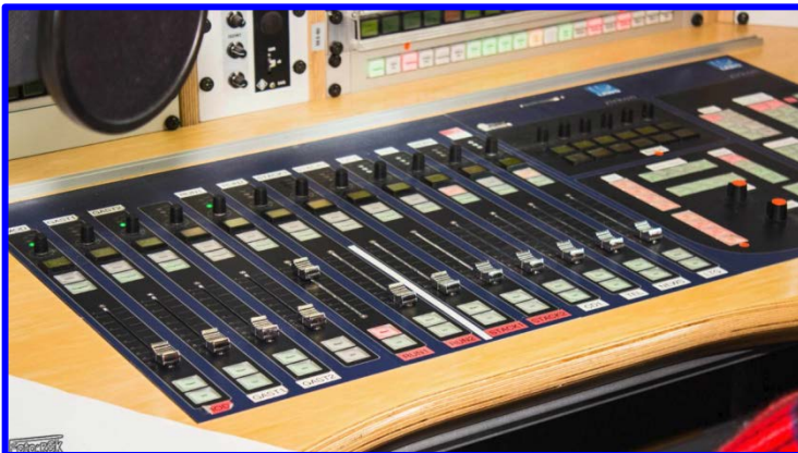
In eine Nahaufnahme des Mischpultes