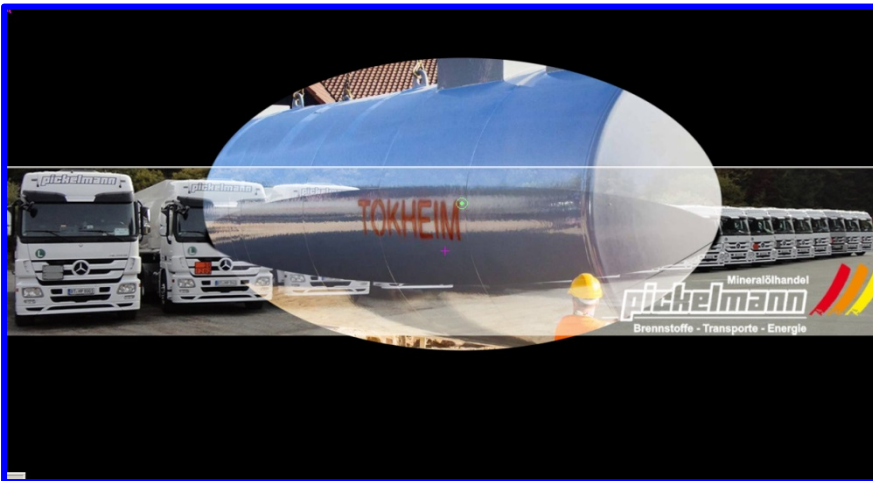
Eine ovale Überblendung (wegen des länglichen Tanks) hier mit scharfer Kante

(Bei Version 7.0 war es noch „weiche Kante“ an gleicher Stelle ist jetzt der „Weichzeichner“)