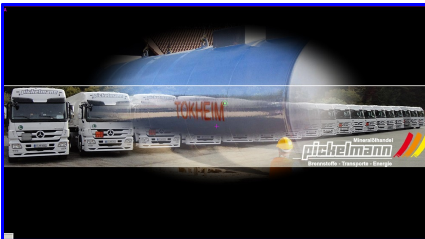
Hier mit einem Weichzeichner von 22%.