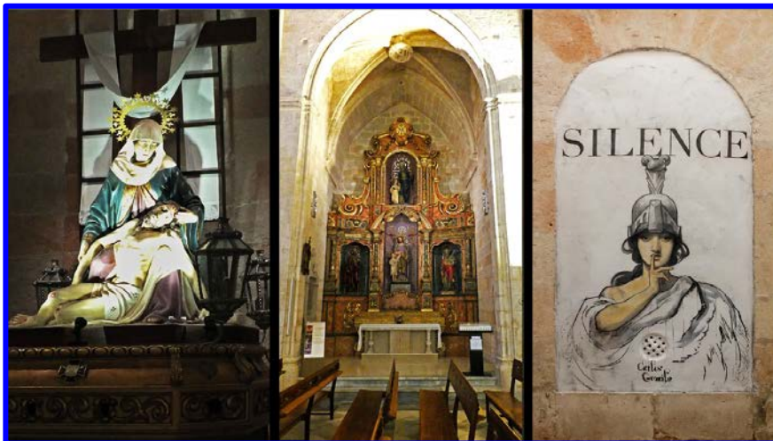
Das ist das Schlussbild