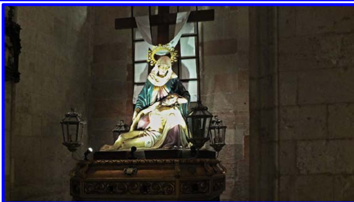
Das erste Bild in voller Breite