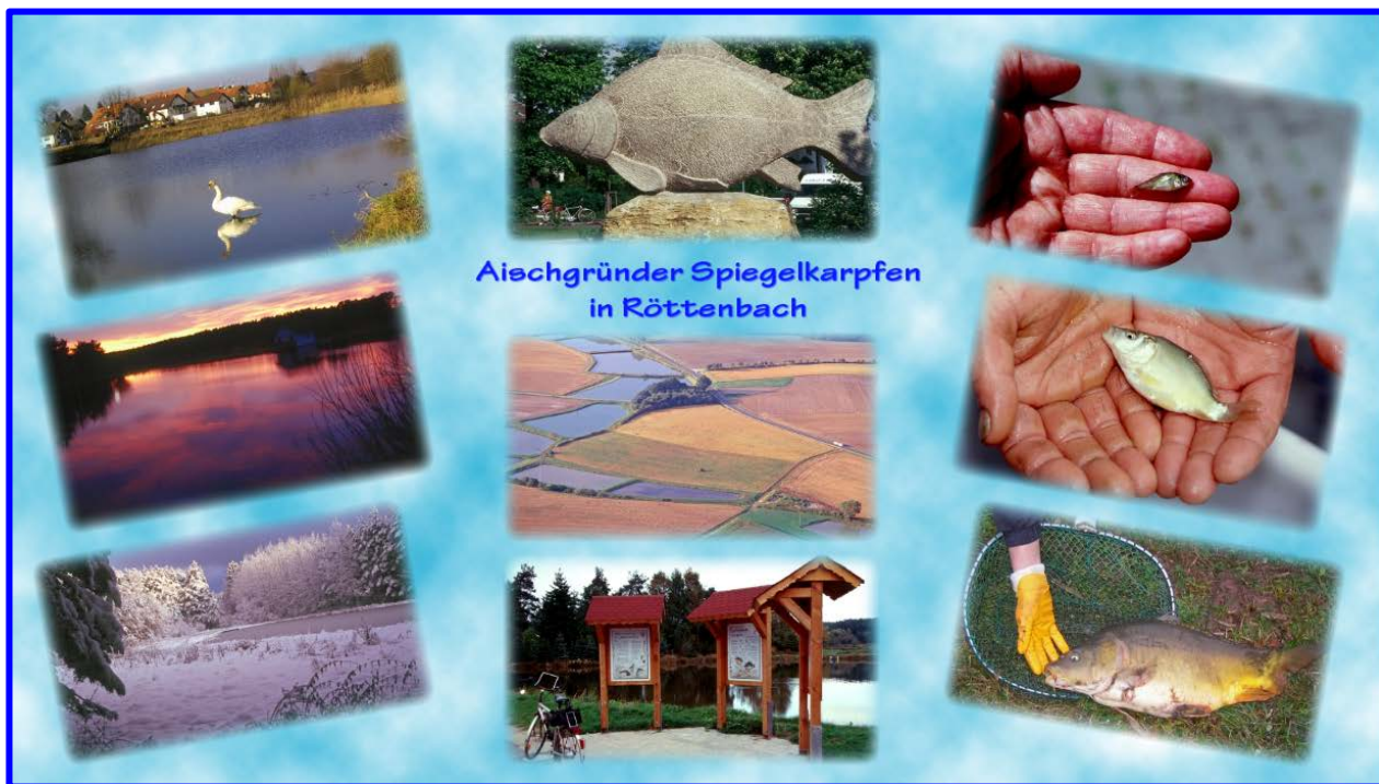
Aischgründer Spiegelkarpfen in Röttenbach