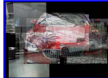
wird segmentweise überblendet in.....