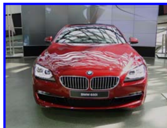
einen einzelnen BMW

Wer sich für diese Überblendung interessiert, kann sich aus der Anlage aus der Blanko mos Datei das Makro aus der Werkzeugleiste kopieren und in der eigenen Schau in der Werkzeugleiste ablegen.