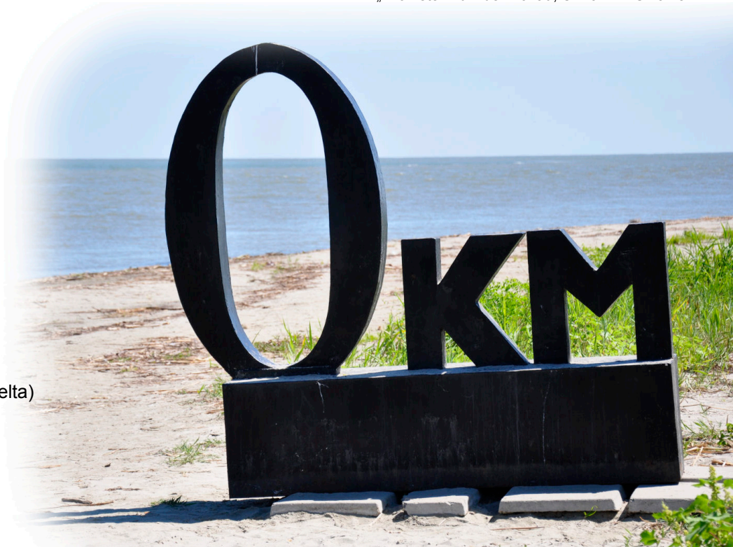
„Kilometer Null“ der Donau, Chilia Arm/Ukraine

Mit meinen Multimediaschauen und Vorträgen möchte ich Anregungen bieten, uns mit diesen Ländern auseinanderzusetzen sowie ihre Geschichte und Bedürfnisse besser zu verstehen. Ich möchte Interesse wecken für diese Region, Voreingenommenheit abbauen und eine Brücke bauen zwischen den etablierten und neuen Ländern einer vergrößerten Europäischen Union.